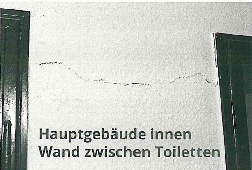
Hauptgebäude innen Wand zwischen Toiletten