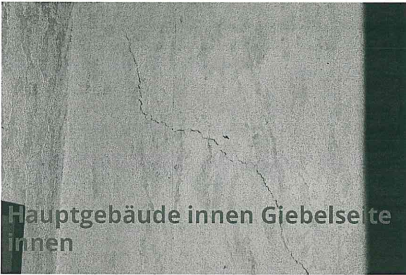
Hauptgebäude innen Giebelseite innen