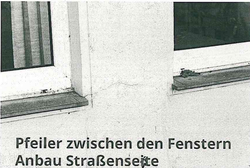
Pfeiler zwischen den Fenstern Anbau Straßenseite