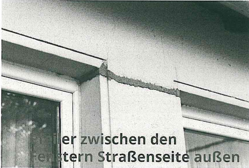
Riss zwischen den Fenstern Straßenseite außen