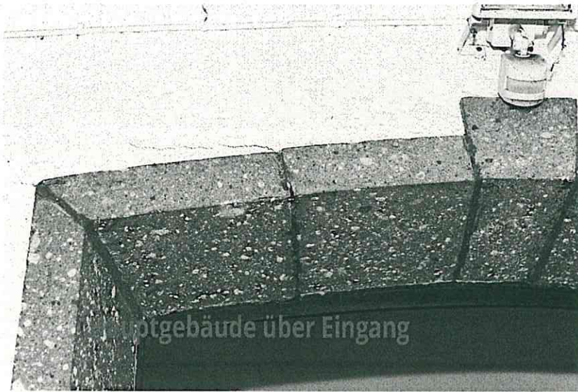
Hauptgebäude über Eingang